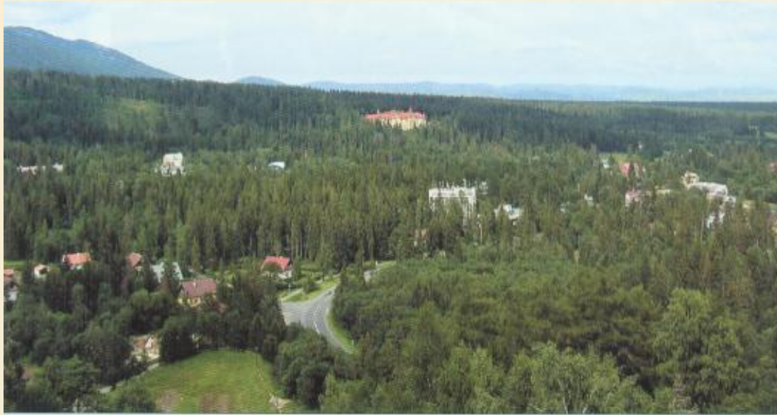
Tatranská Lomnica - stav pred 14. novembrom 2004