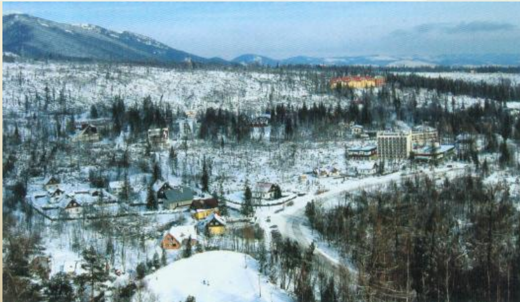
Tatranská Lomnica koncom novembtra 2004